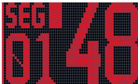
Fig.4 (Segment 1, 48 minutes 59 seconds left)