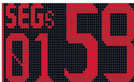
Fig. 5 Counting down last minute (Segment 1, 59 seconds left)