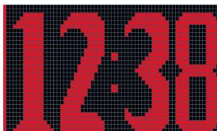
Fig.9 Clock (12:38)