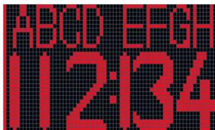
Fig.8 Scoreboard (Team ABCD: Team EFGH =112:134)

按记分牌按钮进入记分牌模式。使用 S+10、S-10、S+1、S-1 按钮设置 T1 分数，使用+10、-10、+1、-1 按钮设置 T2 分数。按并按住 CLR 按钮重置所有分数。（手机 APP 中 T1 或 T2 各可设置 4 个字母，并同步到计时器当蓝牙连接时）