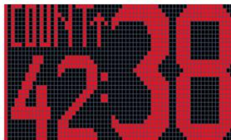
Fig.7 Count up (42 Minutes 38 Seconds)

注意：当向上/向下计数时，切换到分段定时器模式将不会在递增/递减计数模式下影响计数，但蜂鸣器会发出相应的蜂鸣声递增/递减计数将被禁用。当分段计时器正在计时时，切换到计数向上/向下模式将禁用分段定时器时间模式中的蜂鸣声。