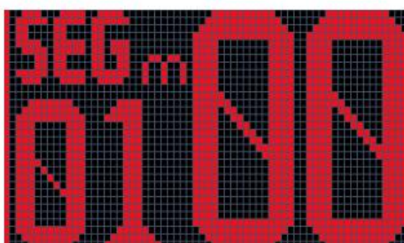
Fig.2 Segment time setting (Segment 1, 0 minute)

按下遥控器上的分段定时器按钮，进入分段定时器模式。默认情况下，段号为 1（2 位左数字），倒计时时间为 00 如图 2 所示，该段（2 位右数字）。