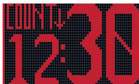
Fig.6 Count Down Time (12 minutes 30 seconds left)

按下遥控器上的向上/向下计数按钮，进入向上/向下计数模式。在倒计时中，按下清除按钮 2 秒以重置之前的设置。这重置后，小时将闪烁，使用+10、-10、+1、-1 按钮设置计数向上/向下小时。设置小时后，按 set 按钮使用+10、-10、+1、-1 按钮设置分钟。设置分钟后，再次按 set 按钮完成设置。（最长为 99 小时 59 分钟。）