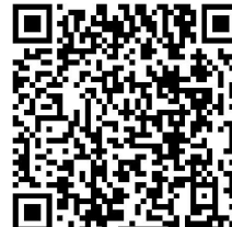
APP Download page for Android (Website)