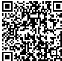
APP Download for Google Play Store