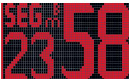
Fig.3 Break time setting (Segment 23, Break time 58 minutes)

使用 S+10、S+1、S-10 和 S-1 按钮更改分段编号，使用+10、+1、-10 和-1 按钮更改该分段中倒计时时间的设置。全部值将被记住，直到进一步更改。当一个片段的倒计时时间设置完毕后，按下 BREAK/segment 按钮，使用+10、+1、-10 和-1 按钮设置该片段的中断时间。设置中断时间时，如图 3 所示，在 “m” 或 “s” 上方打开 “B”。